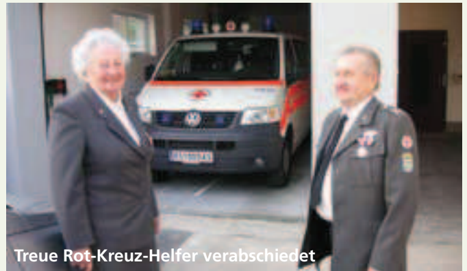
Treue Rot-Kreuz-Helfer verabschiedet