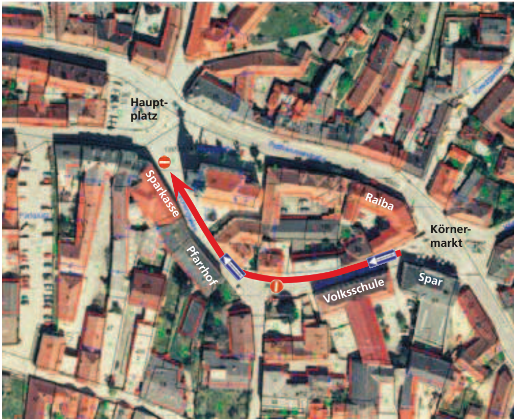
Luftbildaufnahme vom Gföhler Zentrum. Der rote Pfeil weist die künftige Einbahnführung.

Zur Aufstellung gelangen damit mit 14. Mai 2007: Verkehrszeichen „Einbahnstraße“: