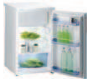
Kühlschrank mit 4-Stern-Gefrierfach

Nutzzinhalt 284 l H x B x T 1435 x 600 x 600 mm Energieeffizienzklasse: A+