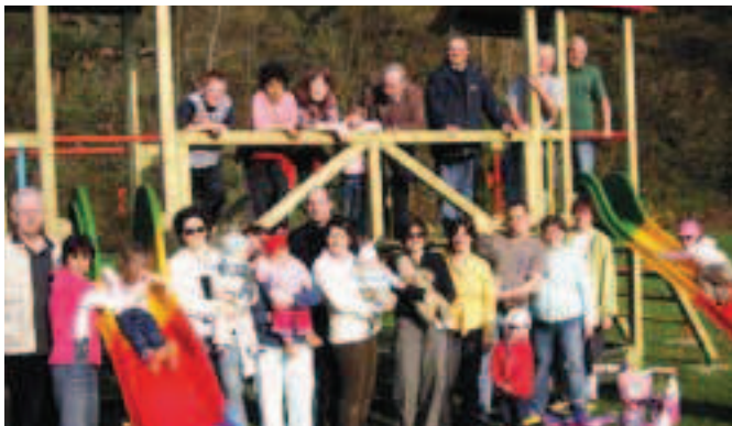
In guter Zusammenarbeit mit einer Elterninitiative wurden Ende März im „Kremstal-Stadion“ in Obermeisling neue Spielgeräte aufgestellt, wofür die Stadt Gföhl die Kosten getragen hat. Aufstellung und Betreuung wurden von den Eltern übernommen.

Entscheidung für Variante 2 gefallen Die Gemeindevertretung legte bei der Variantenentscheidung in erster Linie Wert auf die zukünftige Versorgungssicherheit, sodass die Variante 2 als sicherste und zugleich wirtschaftlichste Lösung gewählt wurde. Am 14. Dezember 2006 fand darüber eine Wasserrechtsverhandlung statt, Baubeginn ist noch 2007, die Fertigstellung ist spätestens 2008 geplant.