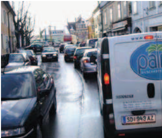
Verkehrssituation bei der Bushaltestelle in der Pollhammerstraße. Die beiden Haltestellen in der Pollhammerstraße werden stillgelegt.